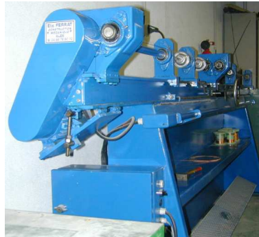
Création d'un Tour à filer les cordes à piano