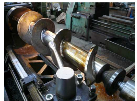
Vis sans fin inox