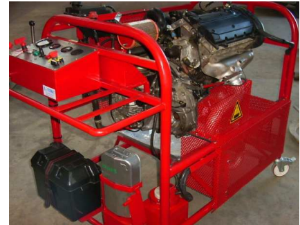
Bancs moteur avec pupitre de commandes, pédagogique pour apprentissage Education