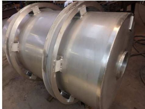
Tonneau imprégnateur inox