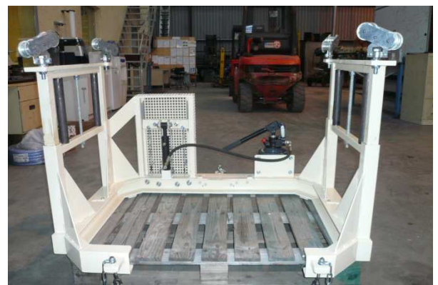
Dispositif d'aide à la manutention de tamis vibrants