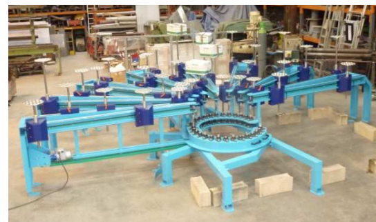
Irradiateur expérimental à 60 plateaux