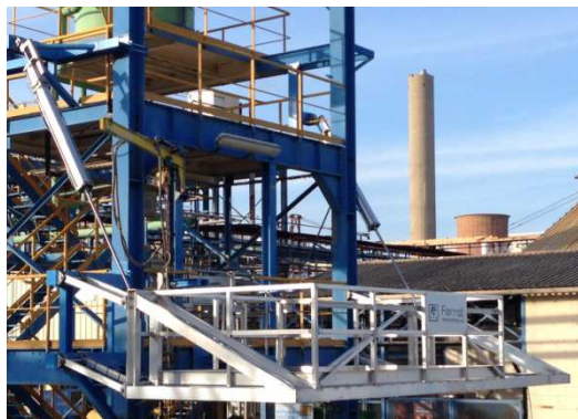
Passerelle Aluminium relevable ATEX