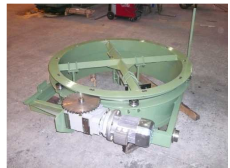
Tiroir répartiteur à béton